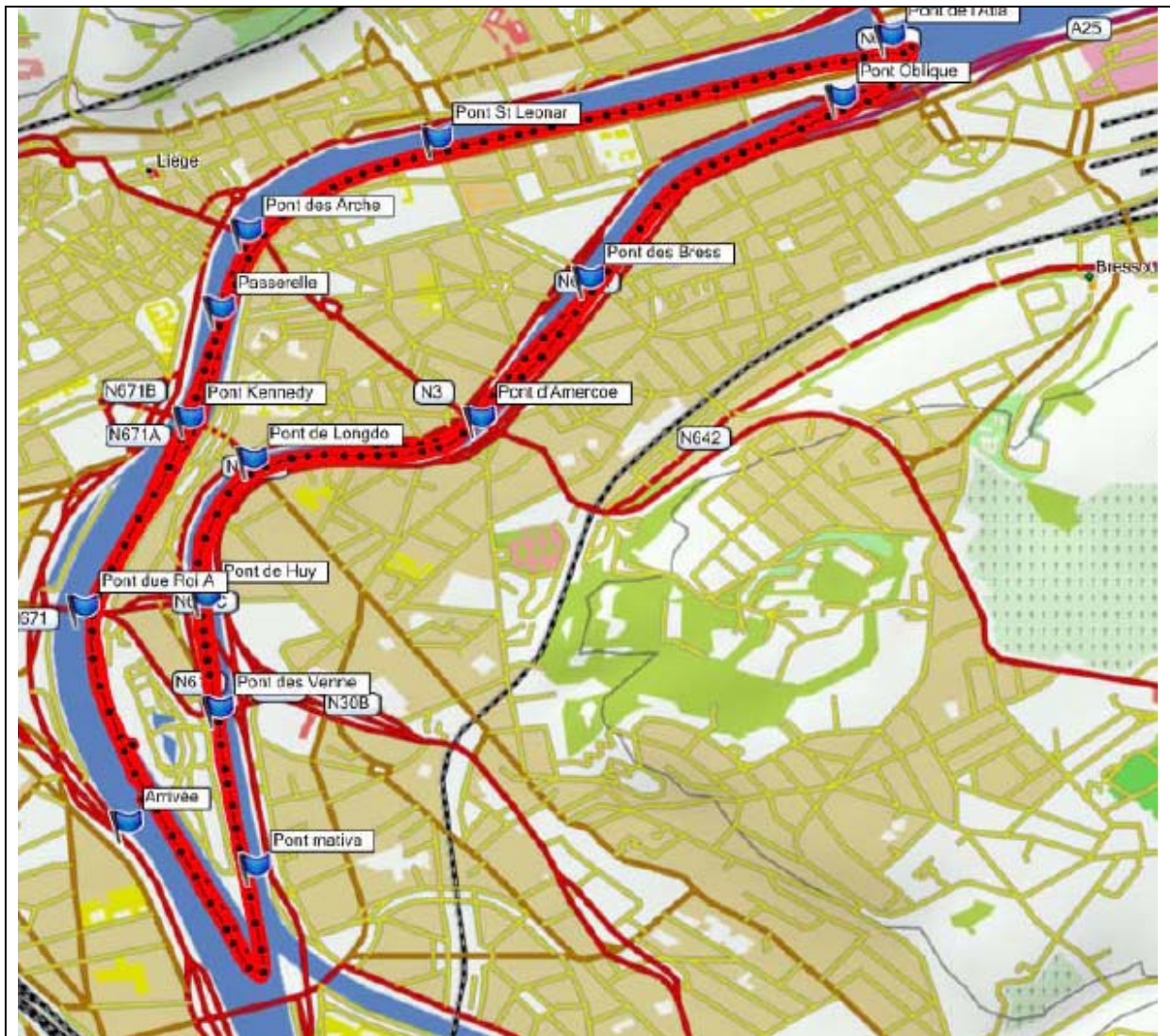
Strecke auf der Maas und zurück durch den Kanal; getrackt mit Garmin gps. Gesamtstrecke 41,6 km.