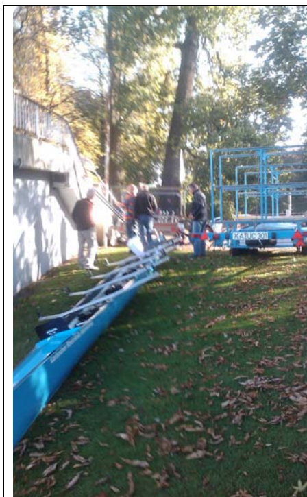
Die Mannschaft beim Aufriggern der KRAke.