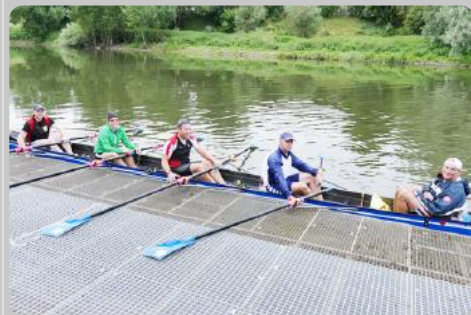
Aktuelles aus dem Verein Medaillengewinne bei nationalen Titelkämpfen